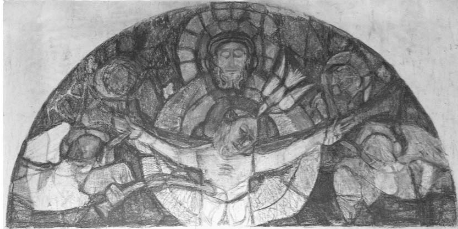
bild rechts: „gnadenstuhl“ in der stadtpfarrkirche wels pfarrkirche mitterkirchen

schon schlohweißes Haar - wenn er längere Zeit nicht beim Friseur war, begann es – wie im Bild - im Wind zu wehen. Gut, er hatte beileibe nicht den Körperrumfang wie dieser Gott am Altarbild. Aber ist Gott ein dicker alter Mann mit einem menschlichen, opa-ähnlichen Gesicht? Ich spüre immer noch mein kindliches Entsetzen.