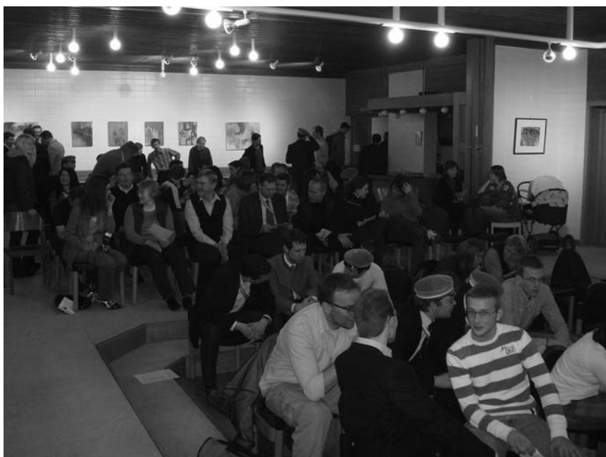
Blick auf das interessierte Publikum beim Vortrag „Gott im Zeitalter von Youtube“ in der KHG-Linz

Nur, wer sich zu anderen aufmacht und in die gesellschaftlichen Fragen hineingeht, kann verstehen, was Glaube und Christsein gerade heute bedeutet.